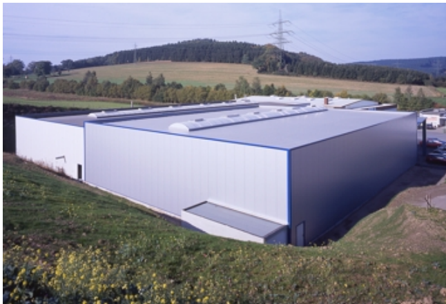
In den Hang gebaut